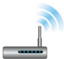
Сетевое оборудование и телефония