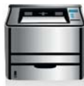
Комплектующие, периферийное оборудование, расходные материалы