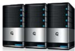
Серверы, настольные ПК и ноутбуки