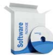
Программное обеспечение, продажа лицензий

RadiusGroup работает с ведущими дистрибьюторами мировых производителей, осуществляет полный ассортимент поставки офисной техники и различного технического оборудования любой степени сложности для создания информационных систем и средств автоматизации.